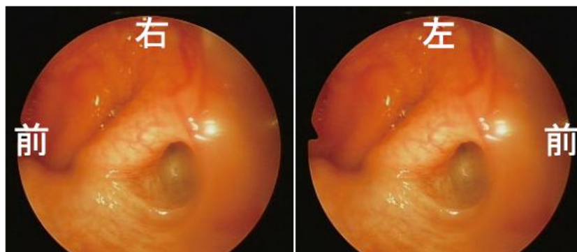
図8 80代, 男性, 両側耳管開放症(原因不明)