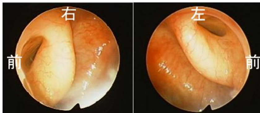
図7 50代, 女性, 両側耳管開放症(透析後の発症)